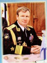
Главнокомандующий Военно-Морским Флотом России адмирал В.В. Чирков